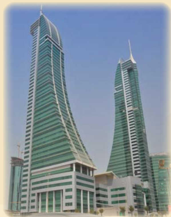
Bahrain Financial Harbour - Sitz von ADIH und Terra Nex

Die Terra Nex verwaltet große Vermögen von institutionellen und vermögenden Privatkunden, die in der Golfregion investieren.