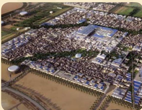
Ökostadt Masdar City in Abu Dhabi*