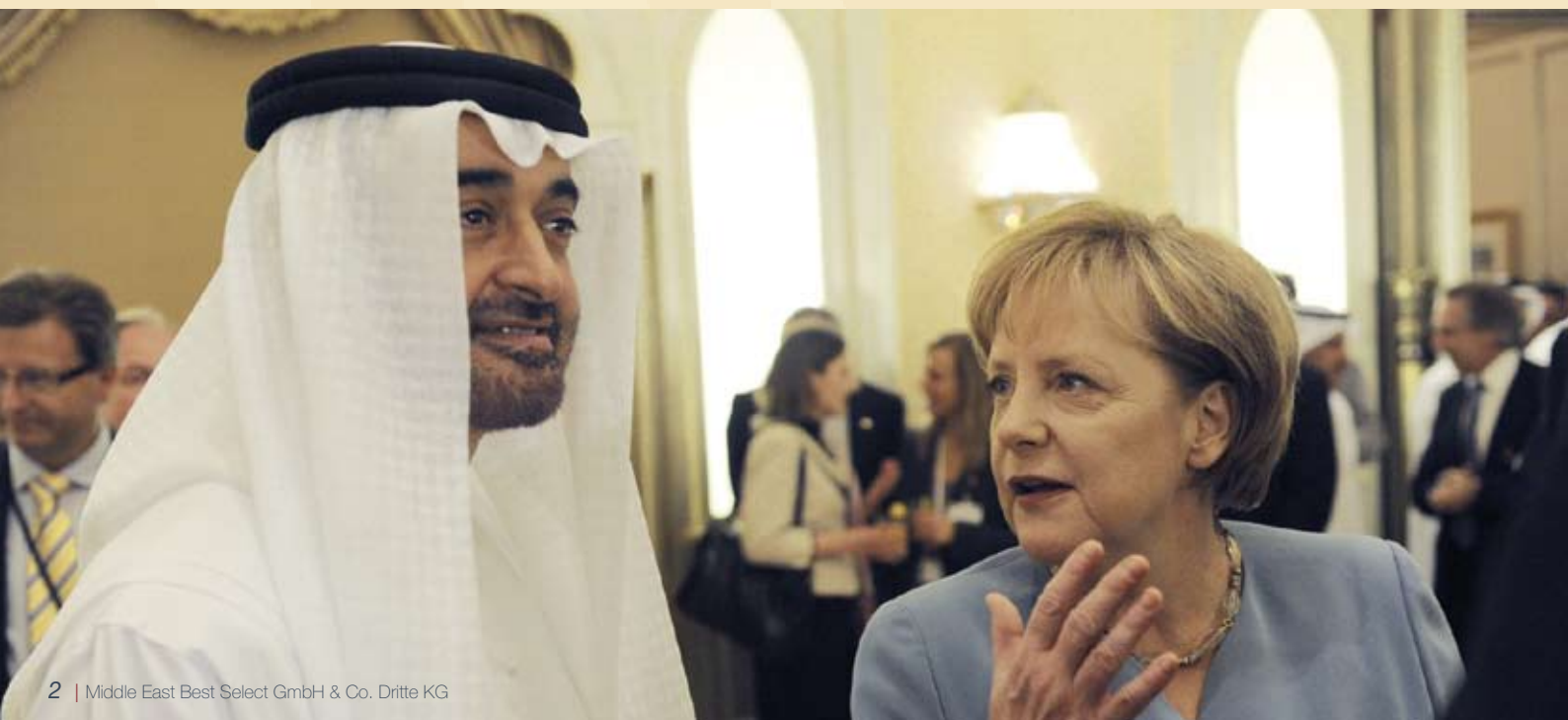
Angela Merkel mit dem Kronprinzen der VAE, Scheich Mohammed bin Said al-Nahjan

Deutschlands in der Golfregion aus, um im Wettbewerb - vor allem mit asiatischen Ländern - bestehen zu können. Die Konkurrenz aus Asien sei stark, stellte sie fest, aber Deutschland könne diesen Wettbewerb bestehen. „Aus meiner Sicht werden die Handelsbeziehungen in den nächsten Jahren zunehmen und wichtiger werden“, betonte die Kanzlerin.