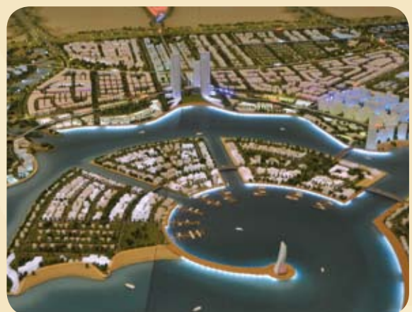
Megaprojekt Lusail City - Die neue 35 km 2 -Metropole in Doha/Katar*