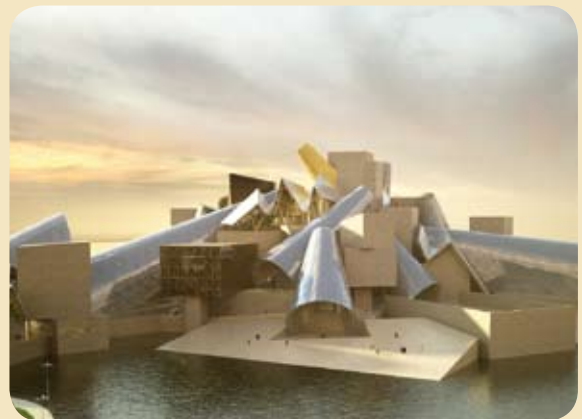
Saadiyat Island/Abu Dhabi - Projektentwurf Guggenheim Abu Dhabi*