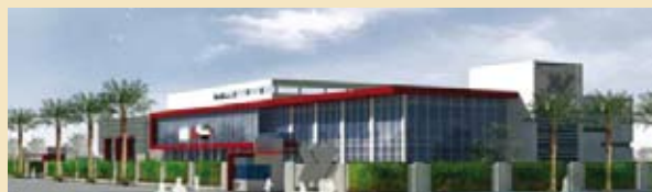
Gebäudeentwurf z. Z. zur Genehmigung eingereicht

Am 1. April 2010 wurde die erste Investition in den Aufbau eines staatlich geförderten Pharma-Unternehmens, Wellpharma Medical Solutions LLC (kurz: Wellpharma) in Abu Dhabi, in Höhe von US-$ 3.000.000 vorgenommen.