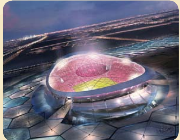
Lusail Iconic Stadium/Katar - Projektentwurf für die FIFA WM 2022*

Das Fonds-Management bevorzugt staatlich geförderte Projekte in Sektoren mit großem Zukunftspotenzial, wie z. B. Erneuerbare Energien, Gesundheitswesen, Bauwesen, Infrastruktur, Logistik, Petrochemie, Bildung, Kultur, IT, Telekommunikation.